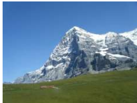
左:ヨーロッパアルプスの大ピラミッドマッターホルン 中央:ヨーロッパアルプス最高峰モンブラン 右:ダイナミックなアイガー